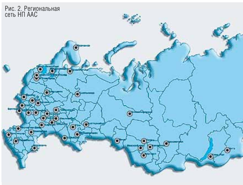
Рис. 2. Региональная сеть НП ААС

в России. В сентябре 2011 года в Санкт-Петербурге прошла конференция «Достоверность. Сохранность. Эффективность». В рамках мероприятия рассматривались такие вопросы как: коррупция и противодействие мошенничеству; борьба с хищением и нецелевым использованием финансовых средств; построение внутренних систем контроля эффективного