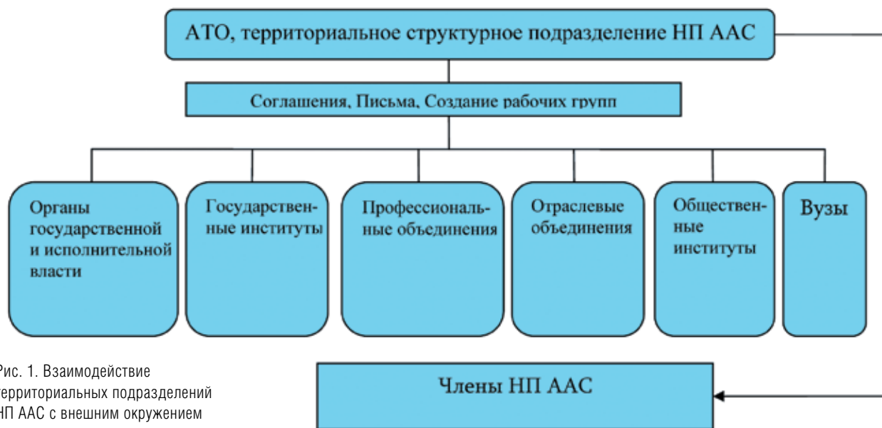
Рис. 1. Взаимодействие территориальных подразделений НП ААС с внешним окружением

территориальных отделений. Руководством НП ААС решен вопрос о распределении ответственности членом Совета ТО, т.е. за каждым членом закреплена профильная региональная комиссия.